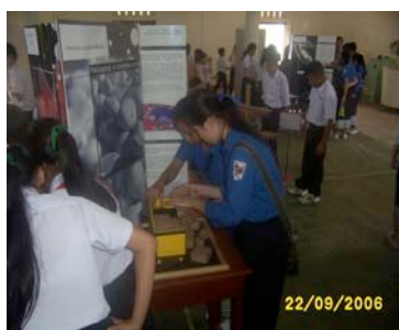
Salle d'expo à Vientiane

Le premier montage et la formation se sont effectués dans la salle des sports du Lycée de Vientiane. Les formés étaient les formateurs laosiens bilingues (6 à 8) en maths qui devaient, non seulement s'approprier le contenu de l'expo mais aussi les aspects techniques pour la démonter et la remonter dans les différents lieux. J'ai pu apprécier la volonté de ces enseignants à comprendre l'esprit de ces présentations un peu déroutantes pour des enseignants de mathématiques.