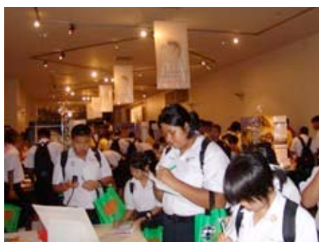
la salle d'expo au NSM

- à Bangkok (de juin à août 2006) au NSM* grâce au SCAC (Jacques Morcos). Prévue pour rester 2 mois, elle pu être prolongée pour être présentée pendant la Semaine de la science en Thaïlande et attirer de ce fait un très large public, en particulier de jeunes collégiens et lycéens (plus de 45 000 visiteurs). ( www.ambafrance-th.org/article.php?id_article=549 )