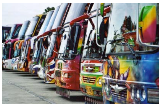
Le transport scolaire devant le NSM