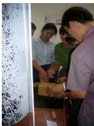
Animateurs en formation