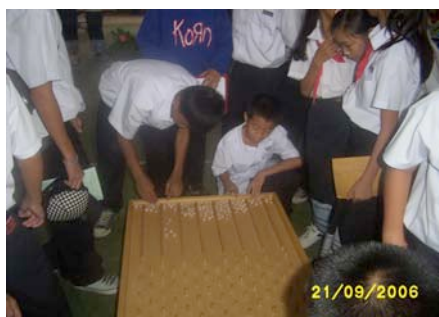
La courbe de Gauss

Financement : La venue de l'exposition a été entièrement financée par le SCAC (coûts de mise à disposition pour 2 mois, mission d'un formateur de Centre·Sciences, transports locaux, envoi de l'expo sur le Vietnam) dans le cadre du projet "Valofrasse". Le ministère de l'Education a participé en mettant à disposition les formateurs et les établissements d'accueil (Lycées et université).