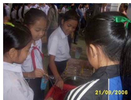
Experience « bulles de savon »

Bilan : Cette opération s'est faite dans le cadre du projet "Valofrassé" (valorisation du français en Asie du sud-est) qui accompagne un programme national de valorisation de l'enseignement du français (concerne le Laos, le Vietnam et le Cambodge).