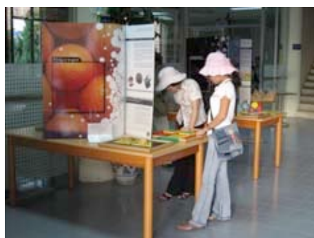
Université de Danang

Le financement a été assuré par le SCAC (Alexis Reickenbach): coûts de mise à disposition, mission d'un formateur de Centre·Sciences, transports locaux et transport sur le Cambodge. Les lieux d'accueil assurent l'animation et la gestion de l'exposition (ainsi que sa traduction à Danang).